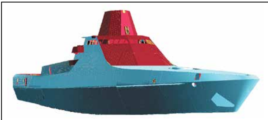
Рис. 2. Электронная 3D-модель корабля