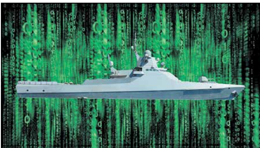
Рис. 3. Цифровой двойник корабля

удобства их монтажа и обслуживания (рис. 2). На очереди – переход к Цифровым двойникам корабля (рис. 3).