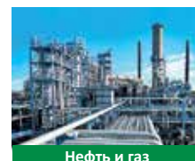
Нефть и газ