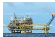
Судостроение и шельф