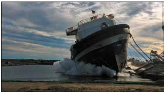
Первый приз в категории фото: Eastern Shipbuilding Group