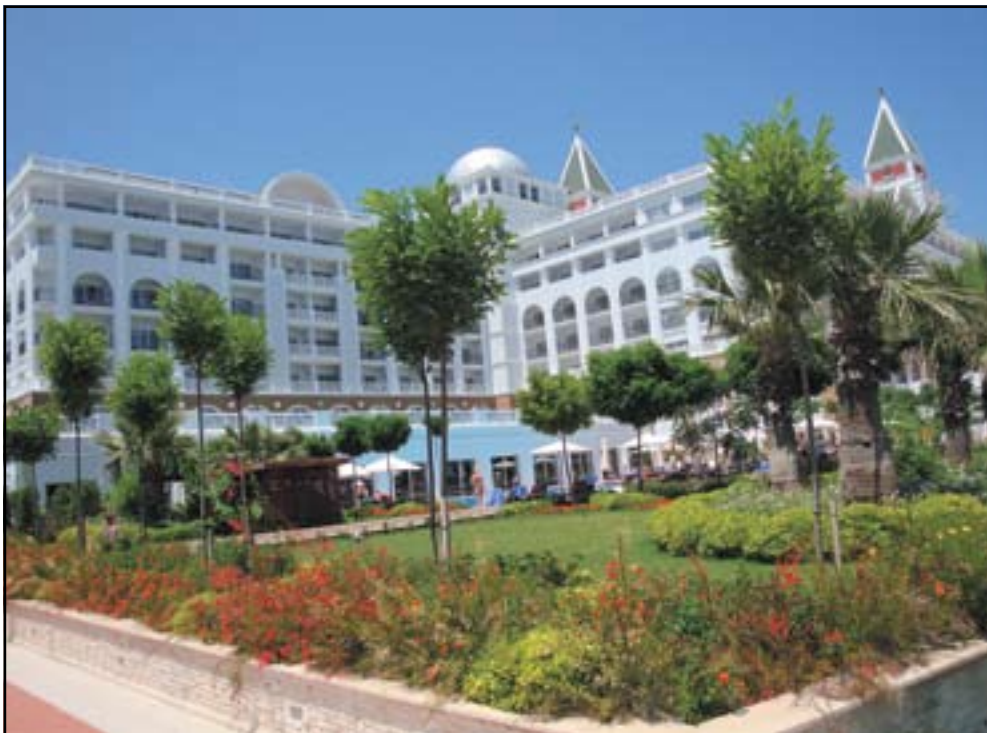
Отель Amara Dolce Vita – место проведения Arbyte IT Forum 2008, Турция, Кемер

Полный перечень услуг, который холдинг Sparxent планирует оказывать в ближайшее время, будет объявлен к концу лета.