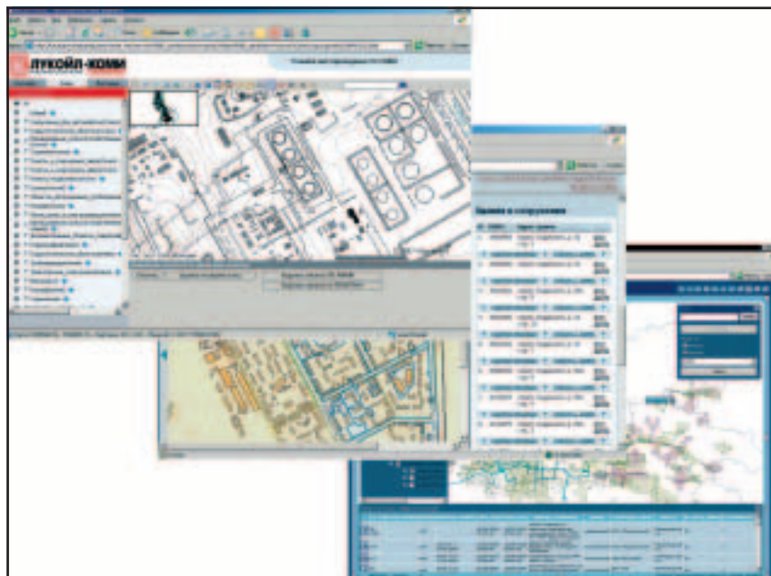
Рис. 1. Корпоративный банк картографической информации. Web-клиент

пользованию, охране окружающей среды, БТИ, Роскартографией, партнерами и подрядчиками).